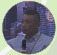
Yi Chiang MFG C38